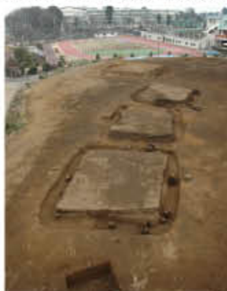
墳丘が残る方形周溝墓（権力者の墓）