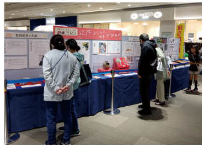
集客施設での展示会