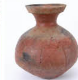
住居跡から出土した後期の赤彩土器（約1,800年前）