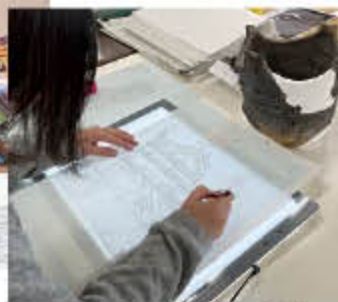
遺物を実測して図にします