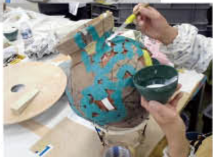
足りないところに石膏を入れて復元や補強をします