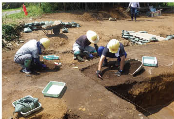
慎重に掘り下げます