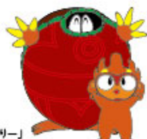
事業団マスコット 「はーとん」「のっそりー」