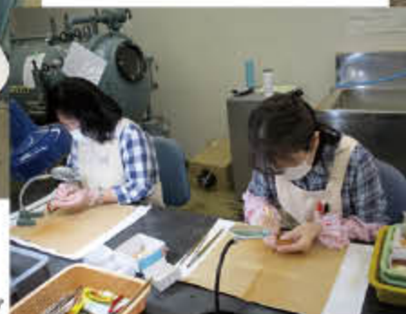
金属製品のクリーニング