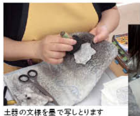
土器の文様を墨で写しとります