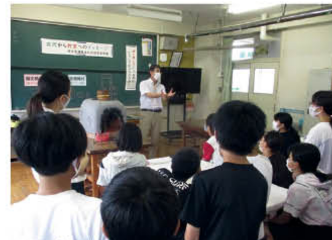
学校への出前授業「古代から教室へのメッセージ」