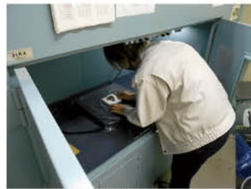
金属製品のX線透過検査

発見された文化財のうち、そのままでは劣化してしまう木製品や金属製品は保存処理を行います。