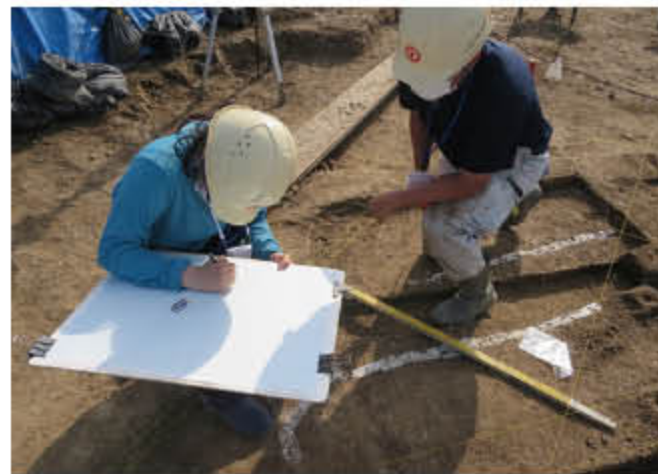
オープンカンパニーの実施