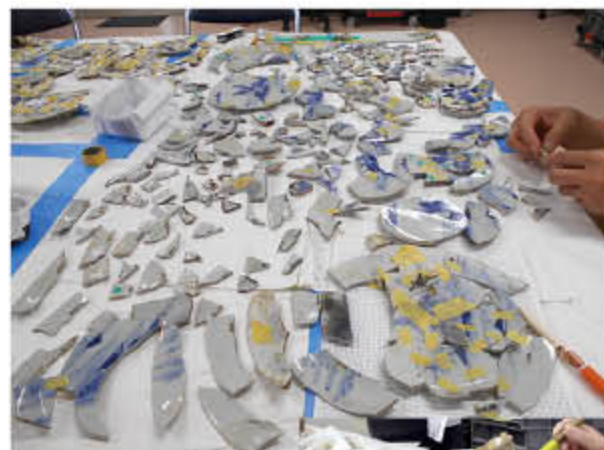
細かな破片を接合します

発掘調査で発見されたさまざまな出土品と、記録された住居跡などの図面を整理し、報告書にまとめて刊行します。