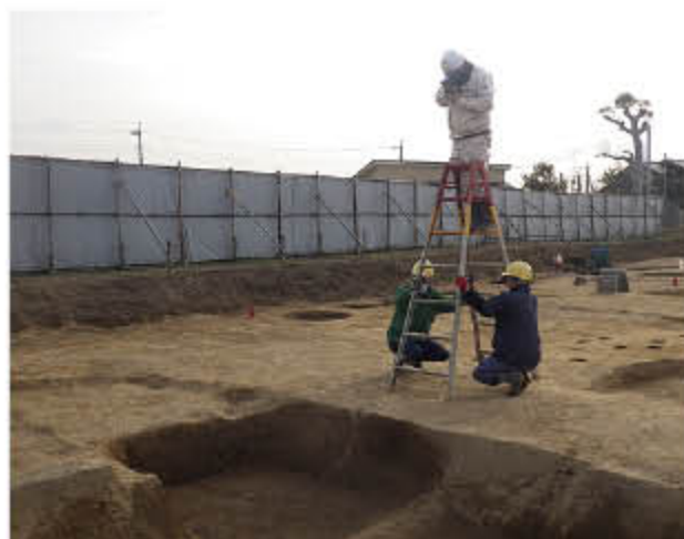
写真を撮影し記録します