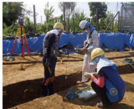
デジタル測量で住居跡や土器の位置を記録します