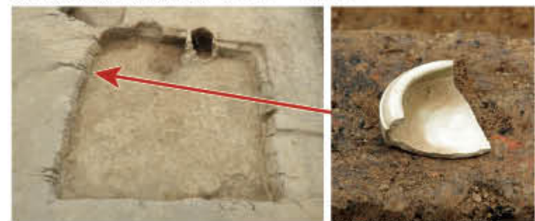
緑釉陶器合子出土状況