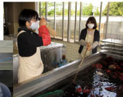
木製品の保存処理