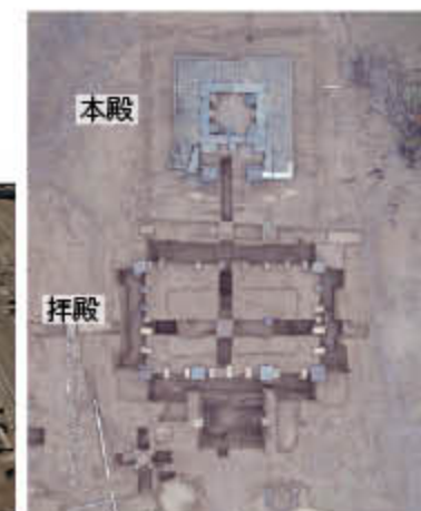
八坂神社 本殿・拝殿基礎