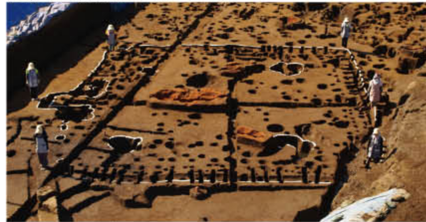
一辺約12mの巨大住居跡