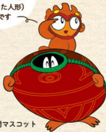
事業団マスコット