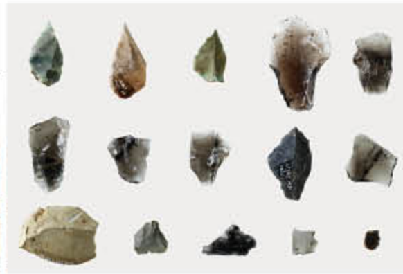
出土した旧石器（約30,000年前）