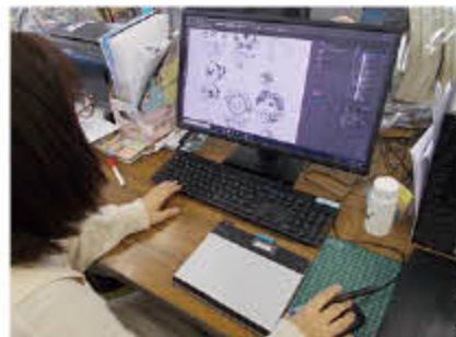
印刷用の図版を作成します