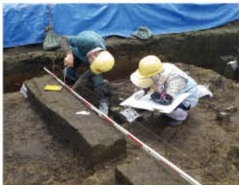
図面を作成します