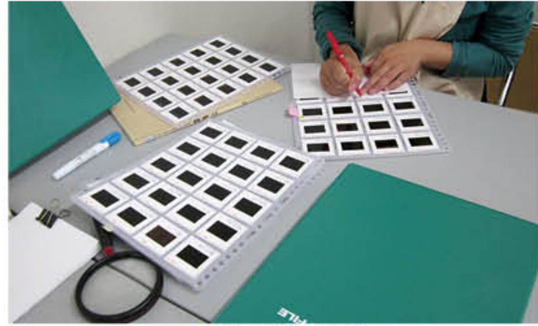
写真整理台帳の作成