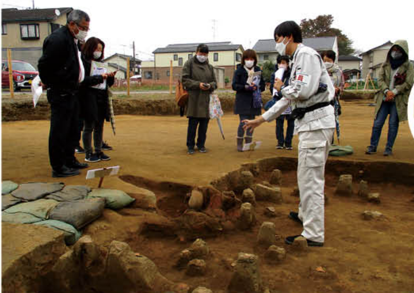
第4回 令和4年11月20日(日) 平右衛門遺跡(鴻巣市) 見学者78人