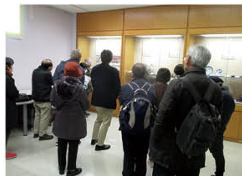
久喜市栗橋文化会館イリス