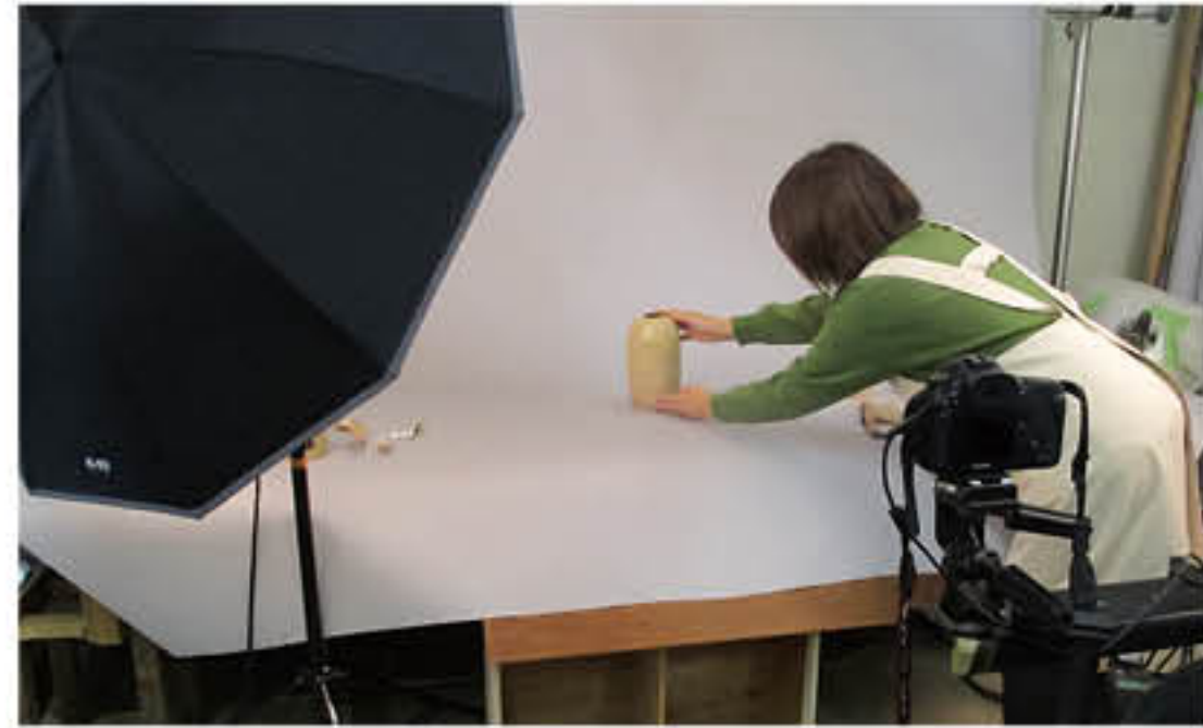
出土品の写真撮影