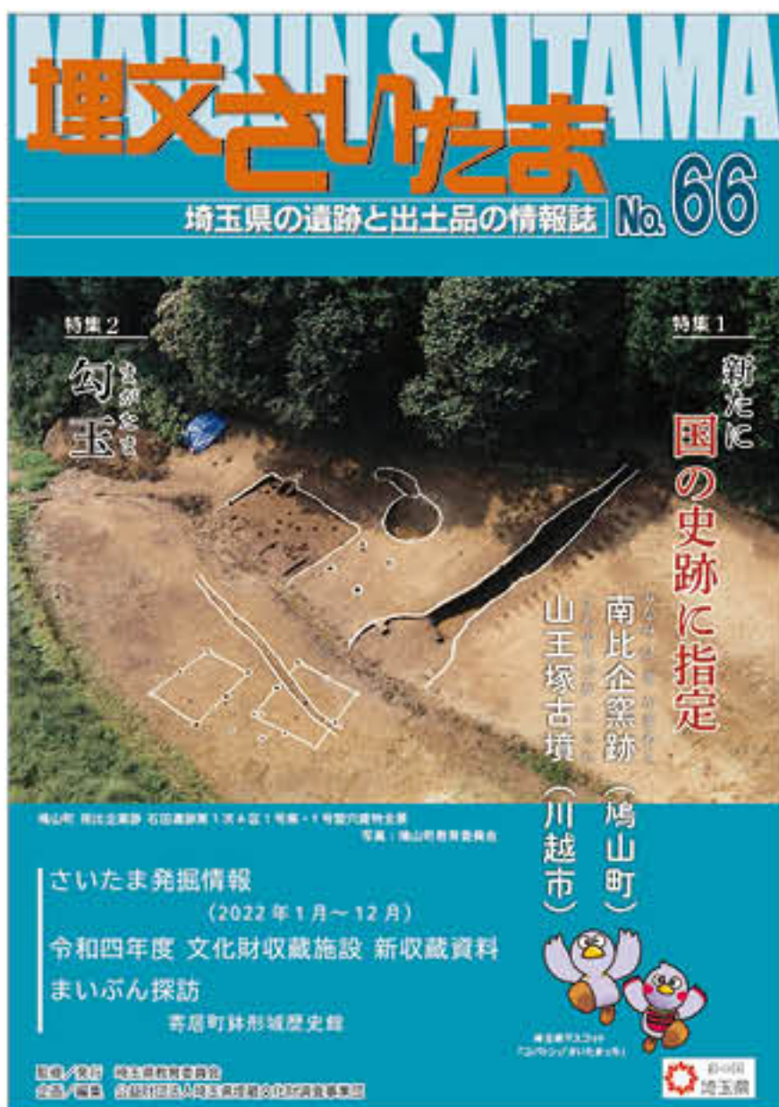
『埋文さいたま』第 66 号