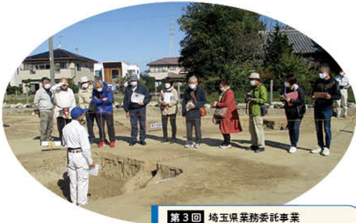
第3回 埼玉県業務委託事業 令和4年10月30日(日) 金久保内出遺跡(上里町) 見学者128人