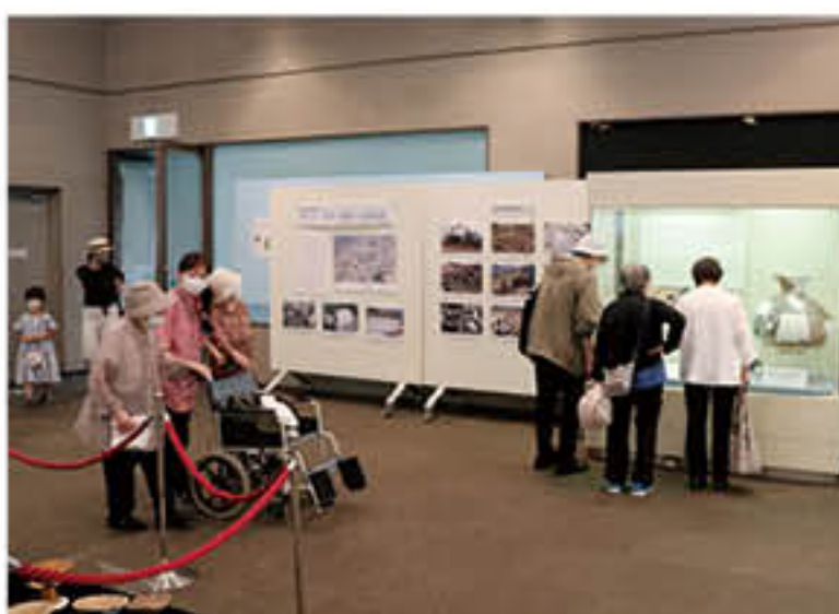
戸田市立郷土博物館