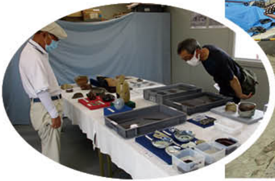
第1回 令和4年7月24日(日) 北2丁目陣屋跡(久喜市) 見学者26人

発掘調査で得られたさまざまな成果や出土遺物をいち早く県民の皆さまにお伝えするため、発掘途中の遺跡の様子や、出土した遺物などを調査担当者が分かりやすく説明し、疑問や質問にもお答えします。 土の中に埋もれていた身近な歴史に触れてみてはいかがでしょうか。