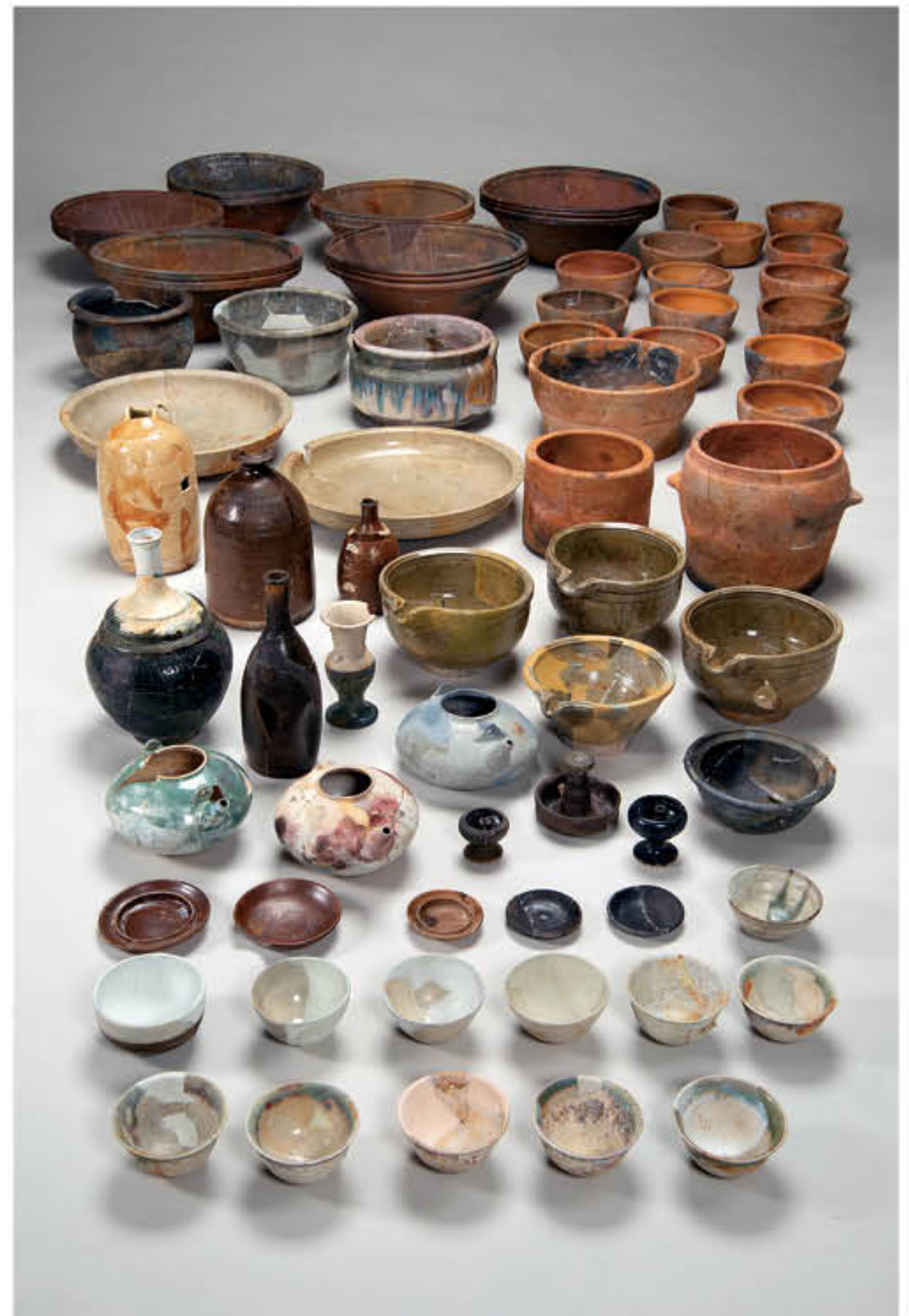
第479集『栗橋宿西本陣跡Ⅰ』（資料所蔵・写真提供 埼玉県教育委員会）