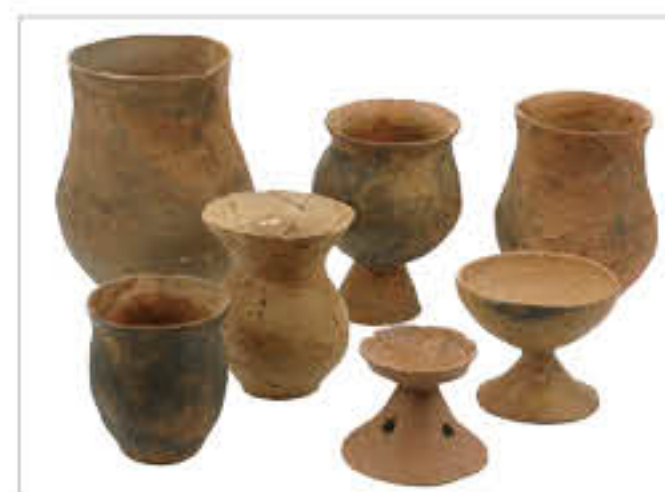
地域別セット（西部）根平遺跡