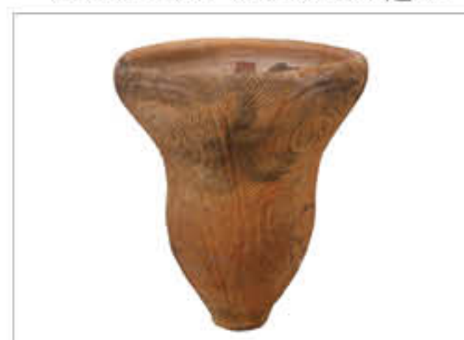
地域別セット（東部）修理山遺跡

運びやすく梱包した学習用キットを無料で貸出しています。地域別・テーマ別など、約120セットの中から選べます。社会科や図工の教材として、あるいは地域の郷土学習の資料として、ご利用ください。参考パネルや体験用の火おこしセットなども用意しています。