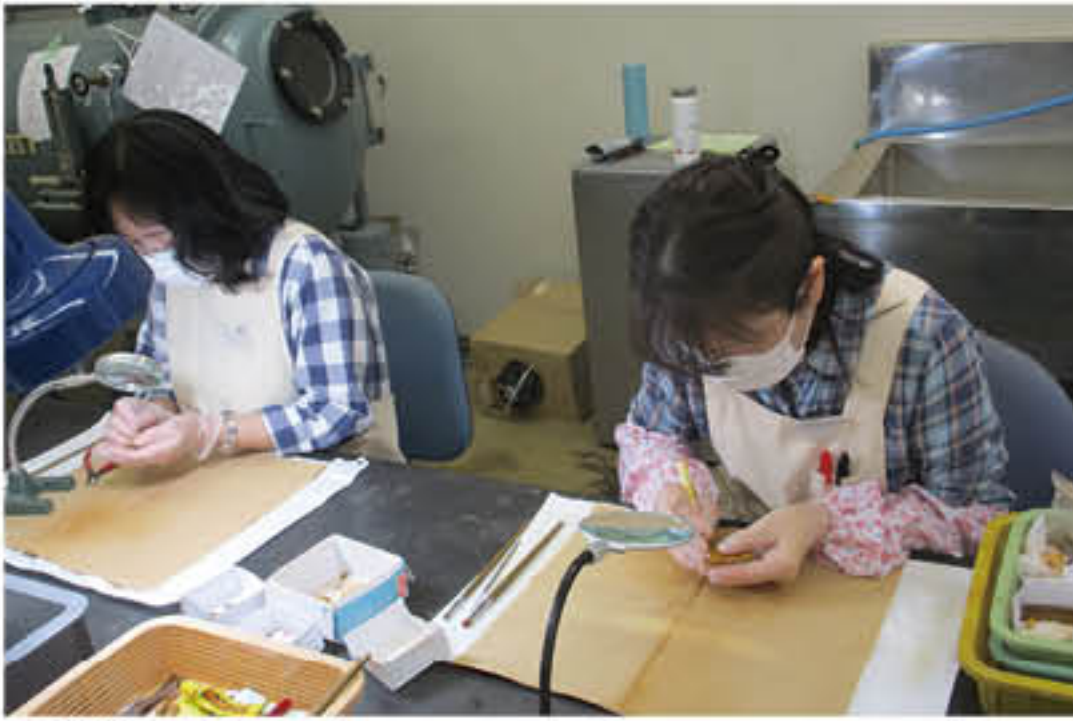
出土金属製品の樹脂含浸処理