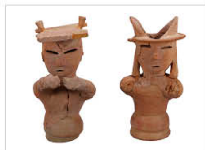
テーマ別セット（埴輪）