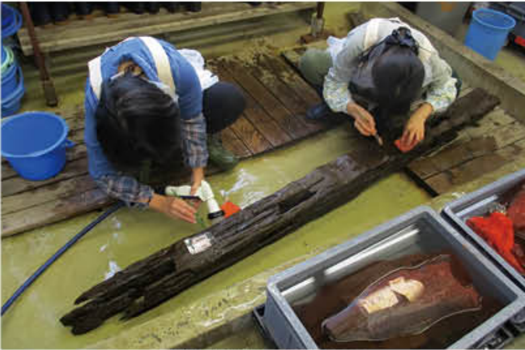
出土木製品の保存処理