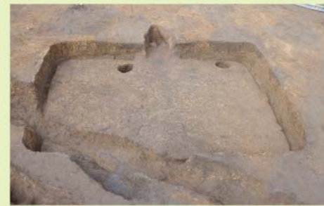
古墳時代の住居跡