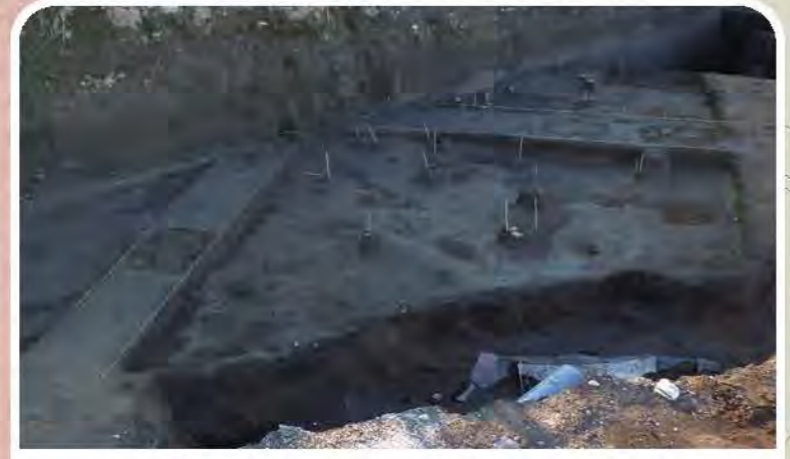
古代の住居跡と考えられる遺構を発掘しています。