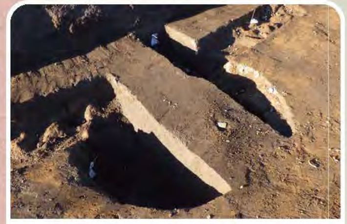
大きな丸い掘りこみが発見されました。近世の井戸跡でしょうか。