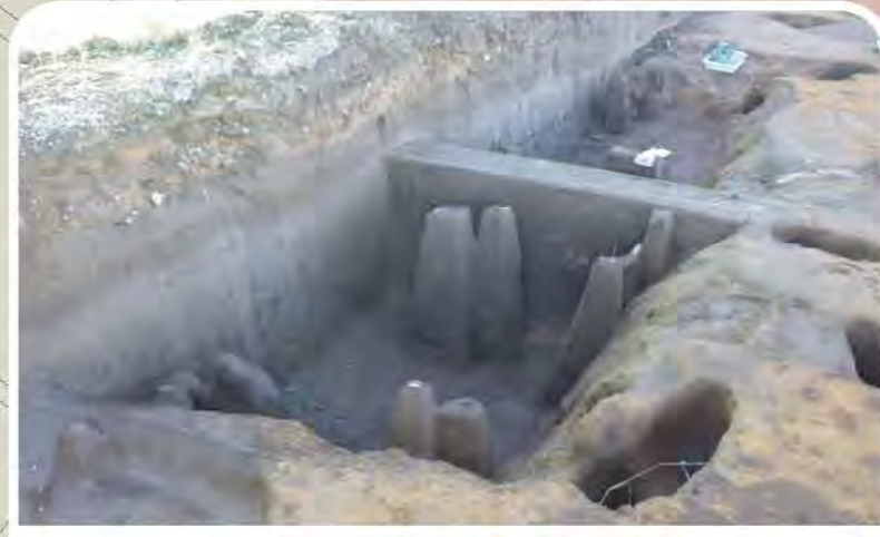
幅約5m、深さ約0.9mの大型土坑です。近世の遺構と考えられます。