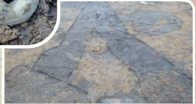
黒い土の中から永楽通宝が出土しました。中世の溝跡の可能性がります。