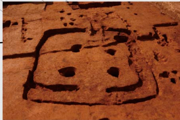
⑤区 第1号住居跡(古墳時代) 壁溝の二辺が二重となっており、拡張した住居跡と考えられます。