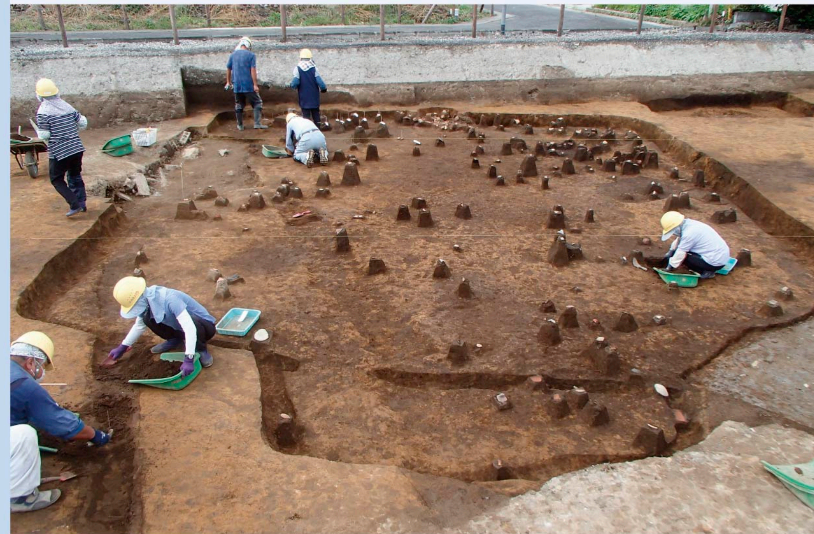
④区 第3号住居跡 大型住居跡遺物出土状況 (古墳時代)

主催 公益財団法人埼玉県埋蔵文化財調査事業団 共催 国土交通省 関東地方整備局 大宮国道事務所 埼玉県教育委員会 後援 鴻巣市教育委員会