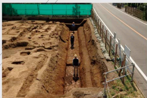
①区 第1号溝跡(中世か) 中山道に沿って幅5m、深さ3mの大溝が見つかりました。