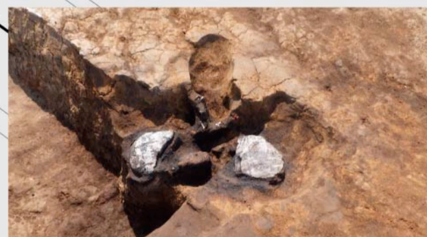
1次2区 第1号火葬跡(中世) 死者を茶毘 たび に付した跡です。煙道が確認できます。