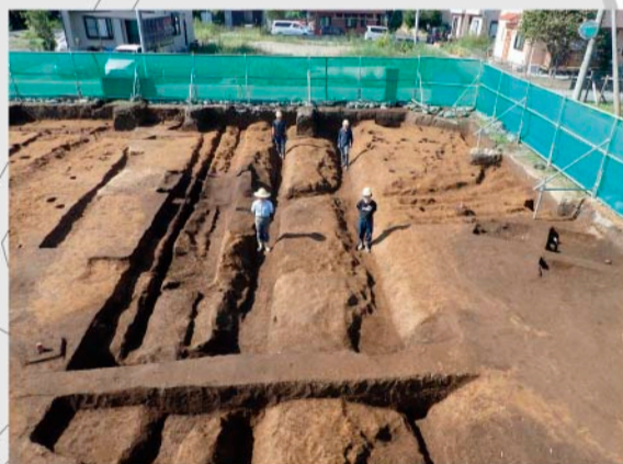
①区 第18～22号溝跡(中近世) 中世と江戸時代の区画溝が並行して走っています。溝の下から奈良時代の住居跡が複数見つかりました。