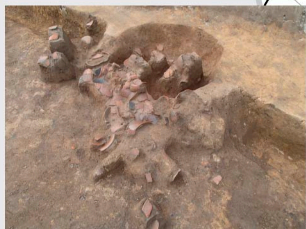
④区 第3号住居跡 カマド遺物出土状況(古墳時代) 大型住居跡のカマドです。両袖は土師器の甕を逆さにしたものを芯材にしています。