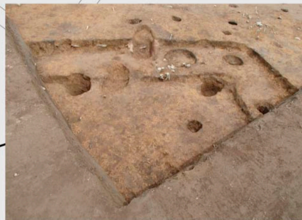
②区 第1号住居跡(古墳時代) 2軒の住居跡が重複して見つかりました。