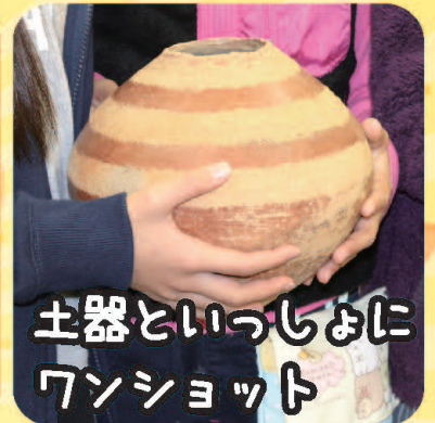
土器といっしょに ワンショット

※勾玉づくりとガラス玉づくりは、それぞれの受付で整理券を配布してからの体験となります。 ※整理券の配布状況によっては早めに受付を終了する場合があります。