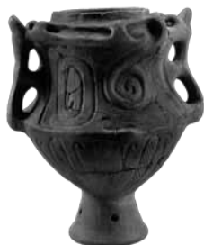
トロフィー形をした縄文土器 (桶川市前原遺跡)