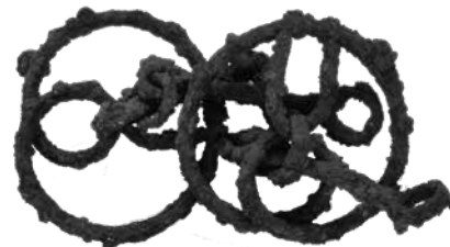
馬の口に付ける轡 くつら (川越・日高市光山遺跡群)