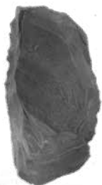
旧石器時代の石斧 (鶴ヶ島市横田遺跡)

今回の企画展では、入間市から幸手市へ、埼玉県を東西に横断する圏央道（正式名称は一般国道 468 号首都圏中央連絡自動車道）建設に伴って発掘調査された代表的な遺跡の出土品を一堂に展示いたします。旧石器時代から江戸時代に至る多くの遺跡発掘調査により、新たに明らかとなった埼玉県の歴史を、考古学的な研究成果を踏まえ、わかりやすく紹介いたします。