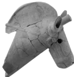
馬形埴輪 (川島町富田後遺跡)