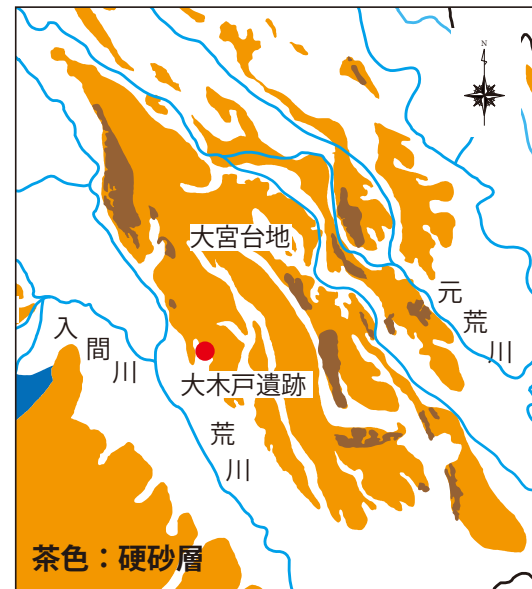
大宮台地と硬砂層の分布

縄文時代の貝塚では、硬砂ブロックに着生したカキが出土している例があり、カキの着床材にも利用されていたと推定されています。また、古墳時代の横穴式石室の石材や古代の住居跡のカマドなどにも使われるなど、古くからさまざまな形で利用されてきたことがわかっています。硬砂は砂が固まったもので、とても崩れやすいことが特徴です。硬砂層はさいたま市の他に、蓮田市や北本市でも確認されています。