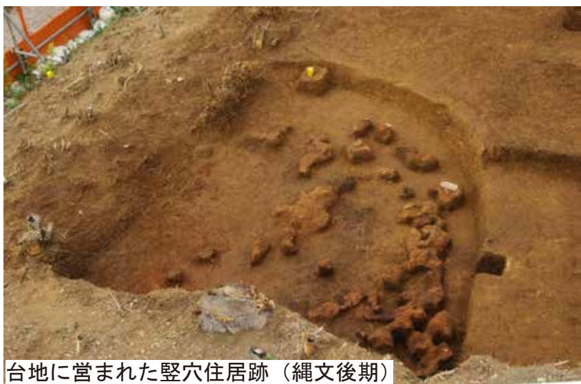
台地に営まれた竪穴住居跡（縄文後期）