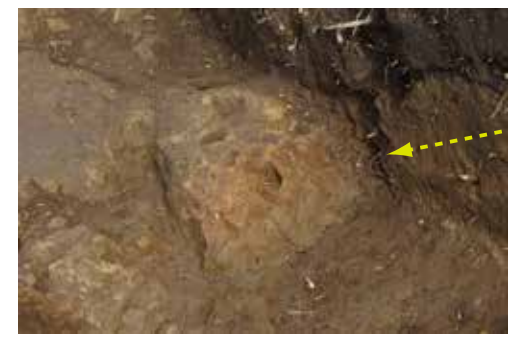
赤く焼けています。