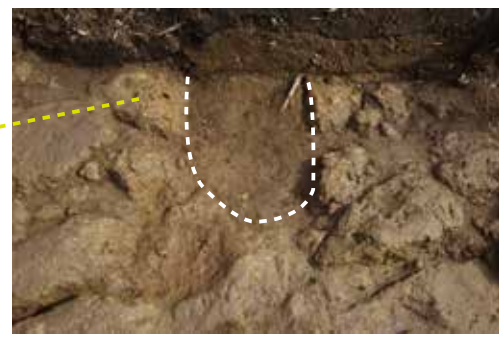
硬砂を利用した炉跡？