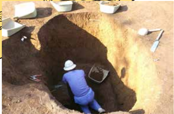
大型土壇 落とし穴でしょうか？