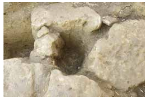
硬砂を掘り込んだピット