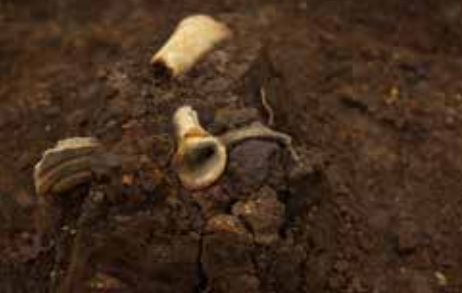
堆積層から出土した土器類