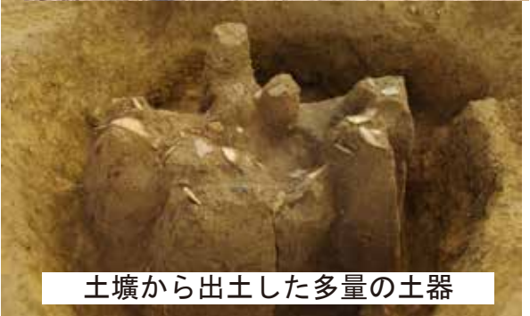
土壇から出土した多量の土器