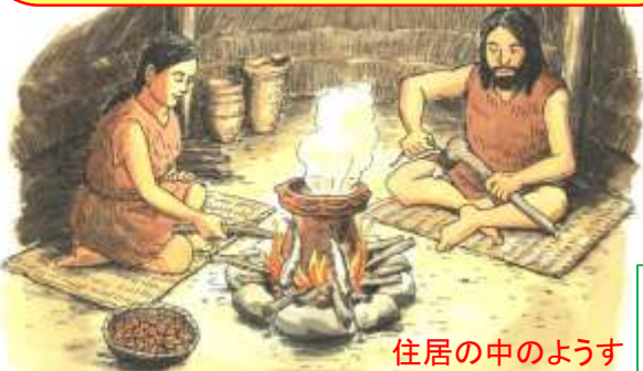
住居の中のような

縄文さんは、お米をつくらず、シカやイノシシをかり、魚や貝をとり、ドングリクッキーを作って食べていました。地面を掘って屋根をかけた家(竪穴住居(たてあなじゅうきょ))に住み、お祈りやおまじないをさかんにしていました。想