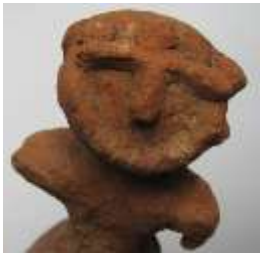
どぐう(お祈りに使った) イヌ(お祈りに使った?)