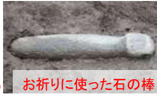
お祈りに使った石の棒